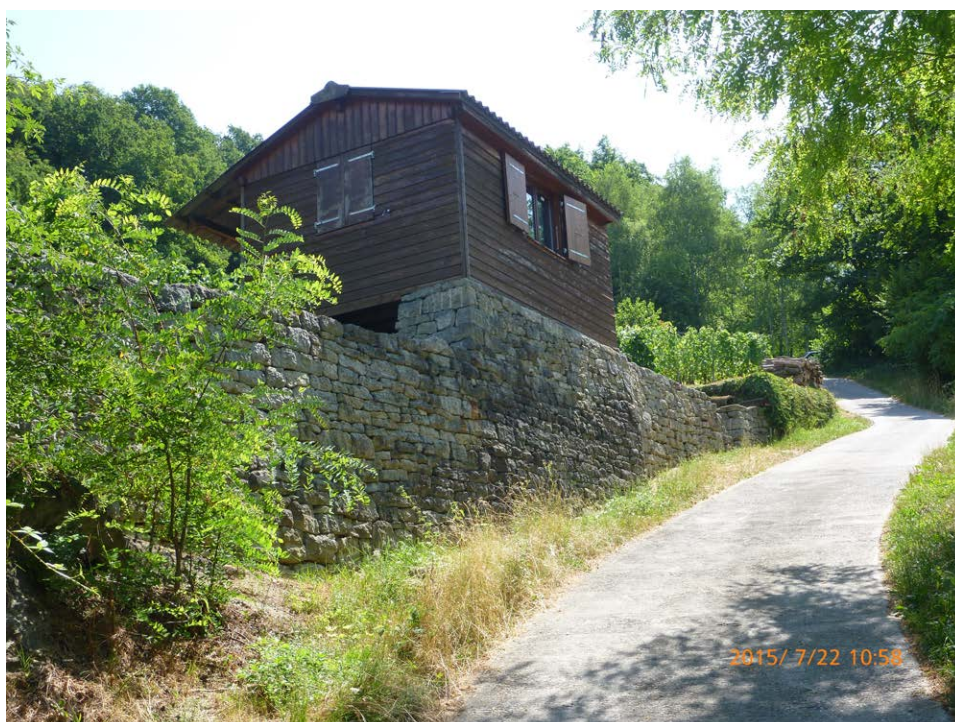
Photos de l'objet 22.07.2015